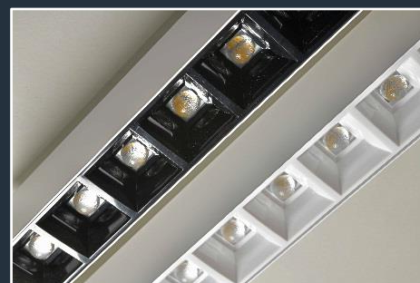
Réflecteurs Noirs / Réflecteur Blancs