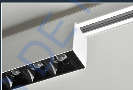
Installation sur rail triphasé (RA)